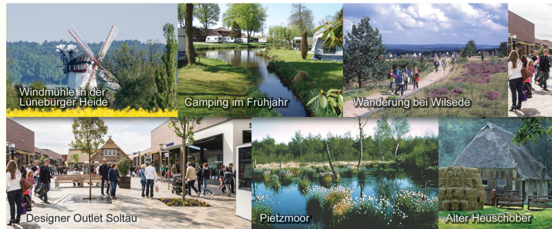
Windmühle in der Lüneburger Heide