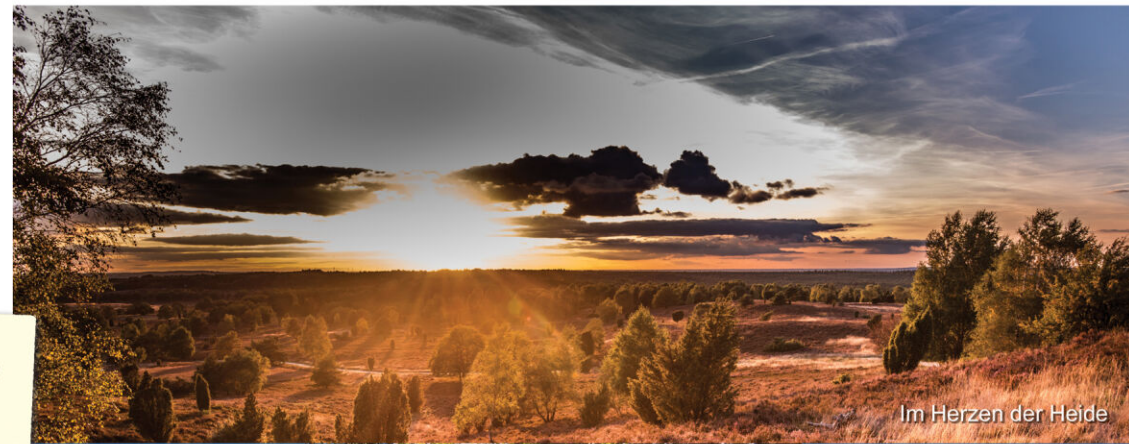
Im Herzen der Heide

In der Saison hat das Gasthaus (fast) jeden Abend geöffnet – im Winter dagegen nur sehr unregelmäßig. Fragen Sie einfach nach!