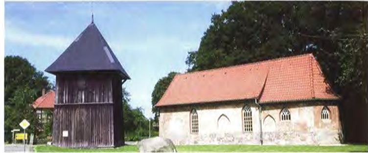
Die Kirche in Wolterdingen hat eine lange Geschichte. Sie wurde im Jahre 2000 umfassend restauriert.

Innerhalb des Naturschutzgebietes folgen Sie bitte der Wegweisung auf den Findlingen und Holzschildern oder richten Sie sich nach Ihren Tourenkarten.